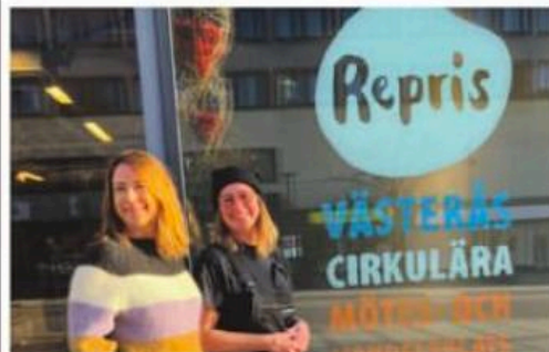
LOKALEN PÅ VASAGATAN 10 kommer att rymma hela 36 olika aktörer och det kommer även finnas möjlighet att ta en fika.